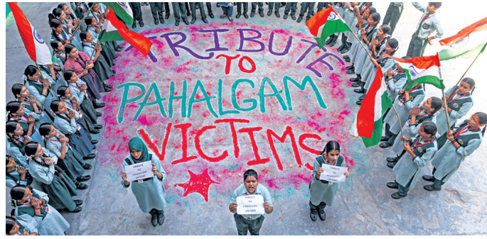
Students make a rangoli paying tribute to victims of the Pahalgam terror attack ahead of its first anniversary in Jammu