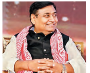
का वितरण किया जा रहा है। प्रदेश के सरकारी स्कूलों में शिक्षकों और विद्यार्थियों पर आरएसएस की विचारधारा थोपने की कोशिश हो रही है। उन्होंने कहा, "जब कांग्रेस की सरकार थी तो हमने आजादी के पहले और बाद का स्वर्णिम भारत पुस्तक 11वीं और 12वीं कक्षा में शुरू की थी। तब राजस्थान के शौर्य, स्वतंत्रता संग्राम, इतिहास के बारे में बच्चों को शिक्षा मिल सके। इसकी प्रशंसा पूरे देश के साथ एनसीईआरटी ने भी की थी। लेकिन अब इन किताबों को स्कूलों में नहीं पढ़ाया जाएगा। अगर