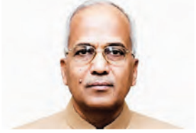
है। उल्लेखनीय है कि कुलगुरु द्वारा पूर्व में आयोजित प्रबंध बोर्ड की बैठक में मंत्रालयिक कर्मचारियों की भर्ती कर्मचारी चयन बोर्ड के माध्यम से किए जाने का निर्णय भी लिया जा चुका है, जो विश्वविद्यालय की पारदर्शी भर्ती नीति को और सुदृढ़ करता है। कुलगुरु के निर्देशों की अनुपालना में विश्वविद्यालय प्रशासन ने रोस्टर रजिस्टर को सार्वजनिक करते हुए सभी संबंधित पक्षों को अपनी सहभागिता सुनिश्चित करने का अवसर प्रदान किया है, ताकि किसी भी प्रकार की त्रुटि या विसंगति को समय रहते चिन्हित और सुधारित किया जा सके।