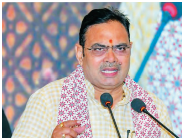
निभा रहे हैं। उन्होंने कहा कि प्रधानमंत्री नरेंद्र मोदी के अनुसार प्रशासन का मूल मंत्र 'नागरिक देवो भव' होना चाहिए। इसी कड़ी में ग्राम विकास अधिकारी आमजन की सेवा में दिन-रात समर्पित होकर कार्य कर रहे हैं। मुख्यमंत्री ने कहा कि ग्राम विकास अधिकारी प्रधानमंत्री आवास योजना से लेकर वीवी जी राम जी, स्वच्छ भारत मिशन, स्वामित्व योजना जैसी योजनाओं को जन-जन तक पहुंचा रहे हैं।

मुख्यमंत्री ने कहा कि सरपंच और ग्राम विकास अधिकारी (वीडीओ) एक-दूसरे से जुड़ी महत्वपूर्ण कड़ी हैं। मैं भी सरपंच रहा हूं, इसलिए जानता हूं कि वीडिओ गांव के विकास की रीढ़ हैं। मैं आज भी जब गांव जाता हूं तो बुजुर्ग, माताएं और किसान अपने कार्यों के लिए मुझसे संपर्क करते हैं और मेरे सरपंच कार्यकाल के कार्यों को याद करते हैं। मुख्यमंत्री भजनलाल शर्मा ने रविवार को मुख्यमंत्री निवास पर राजस्थान ग्राम विकास अधिकारी संघ के अभिनन्दन कार्यक्रम में वीडिओ से संवाद के दौरान यह बात कही। उन्होंने कहा कि ग्राम विकास अधिकारी गांव के विकास का आधार हैं। वे जरूरतमंदों तक जनकल्याणकारी योजनाओं का लाभ पहुंचाते हैं और ग्रामीणों के सपनों को पूरा करने में योगदान भी देते हैं। उन्होंने कहा कि केन्द्र व राज्य सरकार की प्रमुख योजनाओं को धरातल पर उतारने में ग्राम विकास अधिकारी अहम भूमिका