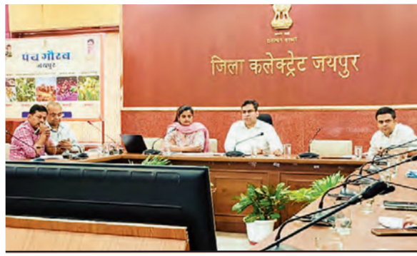
सशक्त कृषक, पशुपालकों एवं ग्रामीण क्षेत्रों के लिए चलाई जा रही प्रमुख योजनाओं और विकास कार्यों की जानकारी ग्रामीण अंचल तक पहुंचाने के उद्देश्य से राज्य सरकार द्वारा एलईडी मोबाइल वैन आधारित जन-जागरूकता हेतु 'ग्राम रथ अभियान' संचालित

राज्य सरकार किसानों को हर क्षेत्र में उन्नत एवं खुशहाल बनाने के लिए 'ग्राम' (ग्लोबल राजस्थान एग्रीटेक मीट) 2026 का आयोजन 23 से 25 मई, 2026 होगा। इस मीट के राज्य स्तरीय आयोजन में हजारों किसान और पशुपालक हिस्सा लेंगे। यह कृषि निवेश, नवाचार, तकनीक, किसान समृद्धि और राजस्थान की संभावनाओं से जुड़ा अभिनव मंच है। मुख्यमंत्री भजनलाल शर्मा के अनुसार यह आयोजन प्रधानमंत्री नरेंद्र मोदी के 'सशक्त किसान, समृद्ध भारत' विजन को धरातल पर उतारने की दिशा में महत्वपूर्ण कदम साबित होगा। राजस्थान सरकार द्वारा