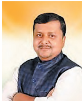
जयपुर में उनके स्वागत में पारंपरिक राजस्थानी रीति-रिवाजों के साथ भव्य आयोजन किए जाएंगे। पुष्कर व गंगानगर के