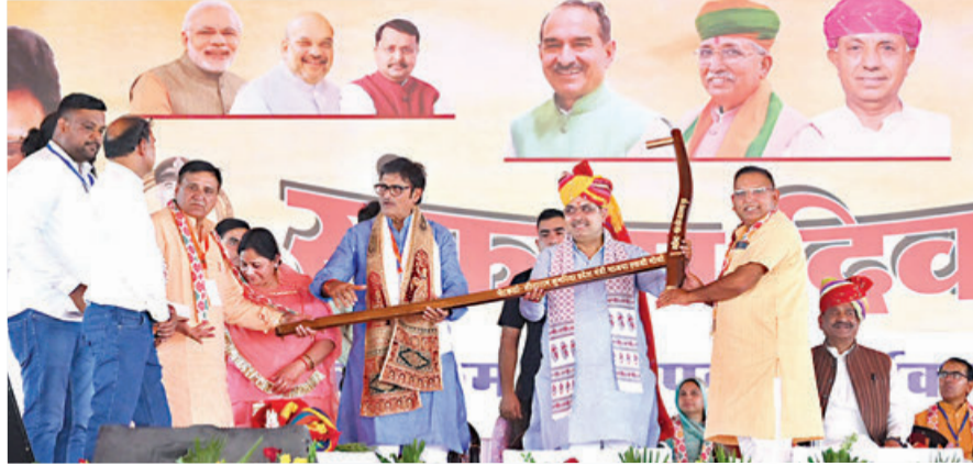
सगत सिंह राठौड़ के सम्मान में चूरू स्टेडियम का नाम सगत सिंह राठौड़ स्टेडियम किया है। इस दौरान मुख्यमंत्री ने लेफ्टिनेंट

आयोजित लेफ्टिनेंट जनरल सगत सिंह राठौड़ के मूर्ति अनावरण एवं 'शौर्य के साथ संकल्प दिवस' कार्यक्रम को संबोधित कर रहे थे। उन्होंने कहा कि लेफ्टिनेंट जनरल सगत सिंह ने 19 साल की उम्र में बीकानेर रियासत की सेना में सैन्य जीवन से शुरुआत की। उन्होंने भारत के पहले हेलीकॉप्टर सैन्य अभियान सहित कई सफल नवाचार भी किए। भारत-चीन युद्ध और बांग्लादेश मुक्त करने के संघर्ष में उनका योगदान युवाओं को साहस और युद्ध कौशल की प्रेरणा देता है। उन्होंने कहा कि हमारी सरकार ने पद्म भूषण और परम विशिष्ट सेवा मेडल से सम्मानित लेफ्टिनेंट जनरल