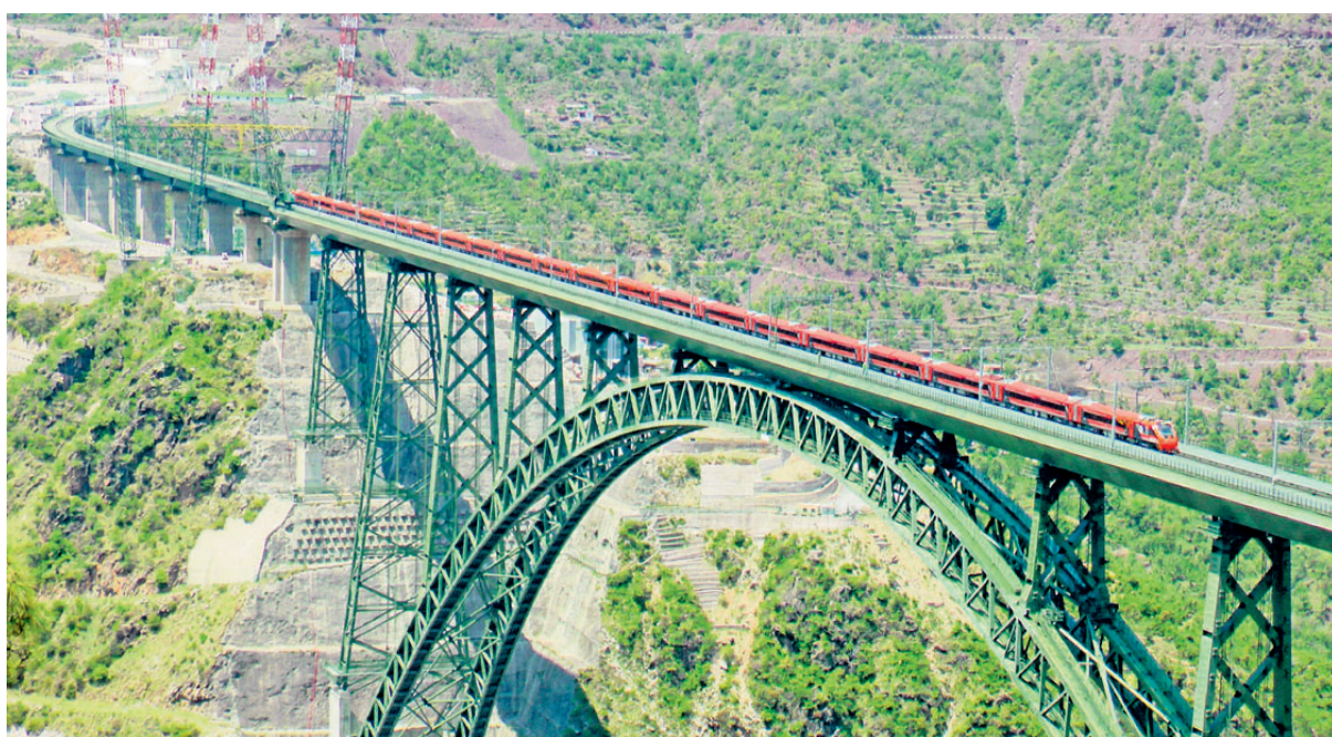
COMMUNICATION BOOST: A Vande Bharat Express crosses Chenab Bridge during a trial run Thursday, as Union Railway Minister Ashwini Vaishnaw flags off the train service between Jammu and Srinagar. Regular services will commence May 2

In India, the RSF said, "Judicial harassment of independent media is intensifying,