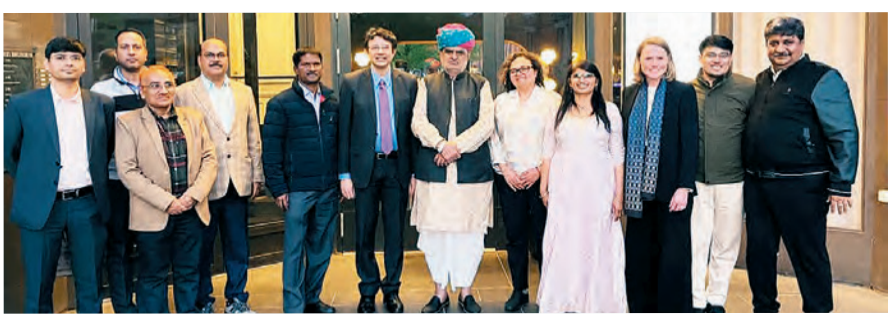
राजस्थान सरकार 'विकसित राजस्थान' के विजन के तहत आधुनिक और नागरिक केंद्रित शहर विकसित करने पर फोकस कर रही है। इसी क्रम में डेनमार्क की राजधानी कोपेनहेगन और आरहूस में राजस्थान के शहरी भविष्य से जुड़े कई महत्वपूर्ण पहलुओं पर चर्चा हुई।

पर विस्तृत मंथन हुआ। बढ़ते शहरीकरण, जल संकट और बाढ़ जैसी चुनौतियों से निपटने के लिए डेनमार्क के मॉडल को उपयोगी माना जा रहा है। UDH मंत्री झाबर सिंह खर्रा का मानना है कि वैश्विक अनुभवों और आधुनिक तकनीकों के समावेश से राजस्थान के शहर अधिक व्यवस्थित, सुरक्षित और स्मार्ट बन सकेंगे। उन्होंने बताया कि डेनमार्क जैसे देशों के सफल शहरी मॉडल राजस्थान के तेजी से बढ़ते शहरों के लिए उपयोगी साबित हो सकते हैं।