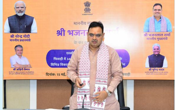
Lal Sharma virtually inaugurated and laid the foundation stone for a 34 MLD Sewage Treatment Plant (STP) and several strategic development projects in the Khairthal-Tijara district from the Chief Minister's residence in Jaipur through video conferencing. The event marked a significant administrative and industrial milestone as Rajasthan positions itself within India's rapidly expanding semiconductor and electronics manufacturing eco-

JAIPUR | In a landmark step toward transforming Rajasthan into a high-tech industrial powerhouse, the state on Friday received its first major semiconductor-linked infrastructure boost with the inauguration and foundation-laying of key development projects at the EL-CINA Electronics Complex in Bhiwadi. Chief Minister Bhajan