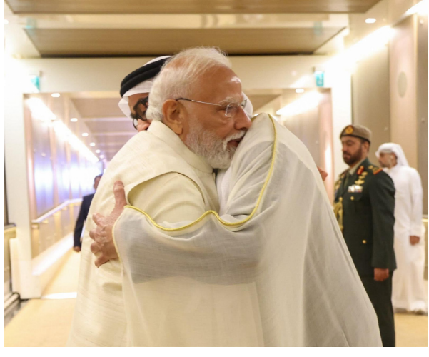
Agreement (CEPA), which has already boosted bilateral trade volumes significantly. The UAE reaffirmed its position as one of India's most important investment and energy partners, while India highlighted opportunities for Emirati companies in infrastructure, manufacturing, digital public platforms, and green hydrogen projects. Officials stated that the visit not only strengthened economic cooperation but also enhanced strategic coordination on regional stability, maritime security, and global supply chain resilience, further cementing the India-UAE relationship as one of the most dynamic partnerships in the emerging multipolar world order.

ABU DHABI / NEW DELHI: Marking another significant step in the rapidly expanding India-UAE strategic partnership, a high-level Indian delegation concluded a "highly productive" visit to the United Arab Emirates with a series of agreements aimed at deepening cooperation across trade, energy, digital infrastructure, logistics, and emerging technologies. The visit reinforced the growing geopolitical and economic alignment between India and United Arab Emirates, with both sides emphasizing long-term collaboration in sectors critical to future economic growth. Senior officials described the discussions as "forward-looking and action-oriented," reflecting the increasing trust between the two strategic partners. Key outcomes included expanded investment commitments in renewable energy, semiconductor-linked manufacturing, ports and