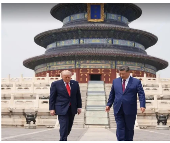
BEIJING / WASHINGTON | May 15—In a development that could reshape the geopolitical balance of the Indo-Pacific, U.S. President Donald Trump has signaled possible uncertainty over future American military support for Taiwan following a high-stakes summit with Chinese President Xi Jinping in Beijing. Revealing rare details from the closed-door discussions, Trump disclosed that Xi directly questioned whether the United States would defend Taiwan in the event of a Chinese attack. Trump responded that he does not publicly discuss such matters. Hours later, when pressed on whether Washington would continue arms sales to Taiwan, the President delivered a terse but consequential statement: "I'll make a decision on that very soon." The remarks have intensified con-