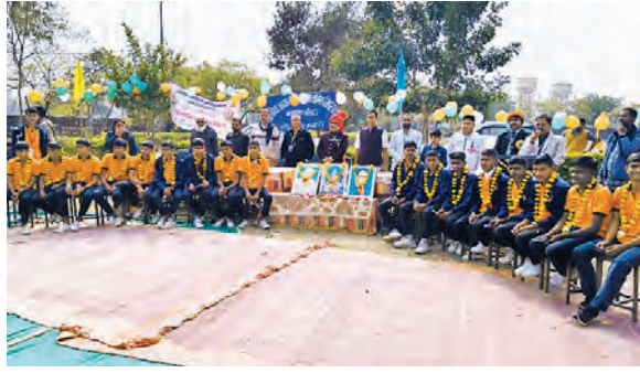
का कोटा शहर जहां शिक्षा नगरी के रूप में पहचान रखता है, वहीं कोटा से लगभग 35 किलोमीटर दूर स्थित मंडाना कस्बा अब उन बच्चों की सफलता की वजह से चर्चा में है, जिन्होंने कठिन परिस्थितियों के बावजूद 10वीं और 12वीं बोर्ड

FAIR REPORT मंडाना (कोटा) मुख्यमंत्री भजनलाल शर्मा की संवेदनशील और समावेशी सोच को धरातल पर साकार करता कोटा जिले के मंडाना कस्बे में संचालित प्रदेश का एकमात्र “भिक्षावृत्ति एवं अन्य अवांछित गतिविधियों में लिप्त परिवारों के बालकों हेतु राजकीय आवासीय विद्यालय” आज सामाजिक परिवर्तन और पुनर्वास की प्रेरणादायक मिसाल बन चुका है। यहां भिक्षावृत्ति और अवांछित गतिविधियों से जुड़े परिवारों के बच्चों ने आम बच्चों की तरह 10वीं और 12वीं में 80% से ज्यादा अंक हासिल कर अनूठी मिसाल कायम की है। राजस्थान