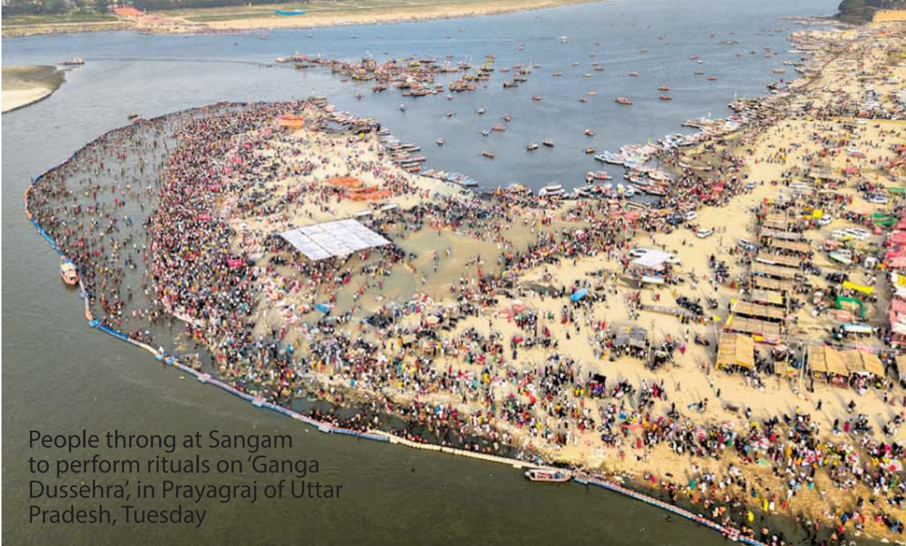
People throng at Sangam to perform rituals on 'Ganga Dussehra', in Prayagraj of Uttar Pradesh, Tuesday