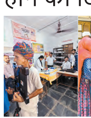
के विजन के तहत जनभागीदारी, तकनीक एवं संवेदनशीलता के साथ स्वास्थ्य सेवाएं उपलब्ध करवा कर हम टीबी की इस जंग को हर हाल में जीतेंगे। चिकित्सा एवं स्वास्थ्य मंत्री गजेन्द्र सिंह खींवर ने कहा कि प्रदेशभर में 24 मार्च से 11,328 हाई रिस्क गांवों एवं वार्डों में विशेष अभियान संचालित किया जा रहा है, जिसके सकारात्मक परिणाम सामने आए हैं। अभियान के अंतर्गत प्रदेश में अब तक करीब 5 हजार आयुष्मान आरोग्य शिविर आयोजित किए गए, जिनमें 18.93 लाख से अधिक व्यक्तियों की टीबी स्क्रीनिंग की गई। समय पर एवं सटीक जांच करने के लिए

मुख्यमंत्री भजनलाल शर्मा की पहल पर राजस्थान टीबी मुक्त होने की दिशा में तेजी से कदम बढ़ा रहा है। राज्य सरकार प्रधानमंत्री नरेन्द्र मोदी के "टीबी मुक्त भारत" के संकल्प को साकार करने के लिए पूर्ण प्रतिबद्धता के साथ कार्य कर रही है। इसी दिशा में संचालित 'टीबी मुक्त भारत अभियान-100 दिवसीय विशेष अभियान' में राजस्थान ने उल्लेखनीय उपलब्धियां हासिल की हैं। इस वर्ष 24 मार्च को शुरू हुए इस अभियान में मात्र दो माह में प्रदेश में करीब 19 लाख व्यक्तियों की स्क्रीनिंग की गई है। मुख्यमंत्री भजनलाल शर्मा ने कहा कि राज्य सरकार द्वारा 'निरामय राजस्थान'