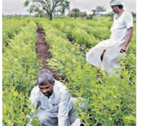
आवश्यक निर्देश जारी किए गए हैं। इस निर्णय से हजारों कृषक परिवारों को समय पर फसल बीमा क्लेम मिल सकेगा। राष्ट्रीय फसल बीमा पोर्टल पर बीमित कृषक द्वारा किसी पारिवारिक सदस्य को मनोनीत किया गया है, तो बीमा दावा राशि का भुगतान तत्काल संबंधित मनोनीत सदस्य को किया जाएगा। ऐसे मामलों में जहां मनोनयन उपलब्ध नहीं है, वहां दिवंगत कृषक के लंबित फसल बीमा दावों का भुगतान न्यायालय द्वारा जारी वैध उत्तराधिकार प्रमाण पत्र, संबंधित तहसीलदार अथवा पटवारी द्वारा जारी वारिसनामा या परिवार के सभी सदस्यों की सहमति से अधिकृत किसी एक पारिवारिक सदस्य को किया जा सकेगा।