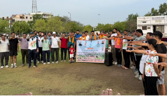
युवा। जिला प्रशासन और जिला खेलकूद प्रशिक्षण केन्द्र के संयुक्त तत्वावधान में आयोजित कार्यक्रम की शुरुआत अतिथियों के स्वागत