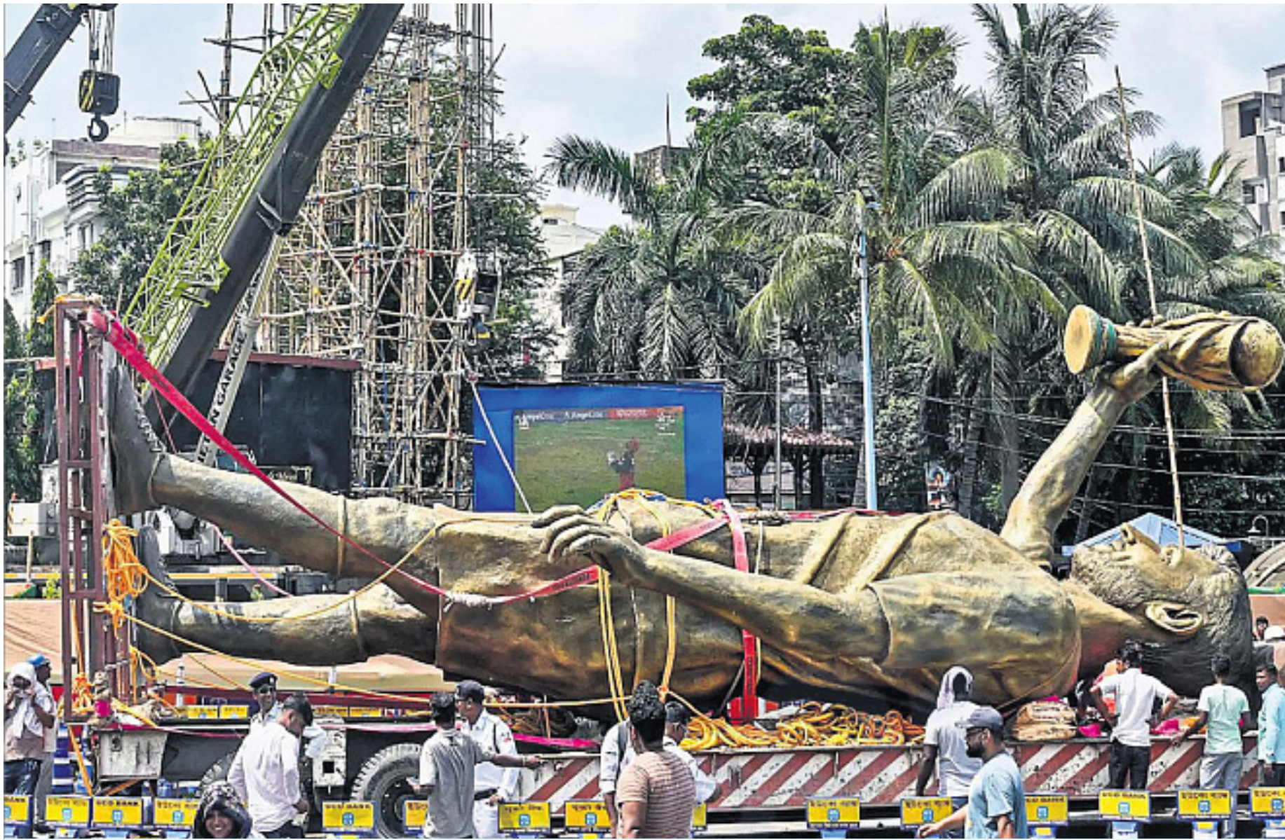
statue will remain in the PWD's custody, and there has been no official announcement regarding where it will be re-erected.