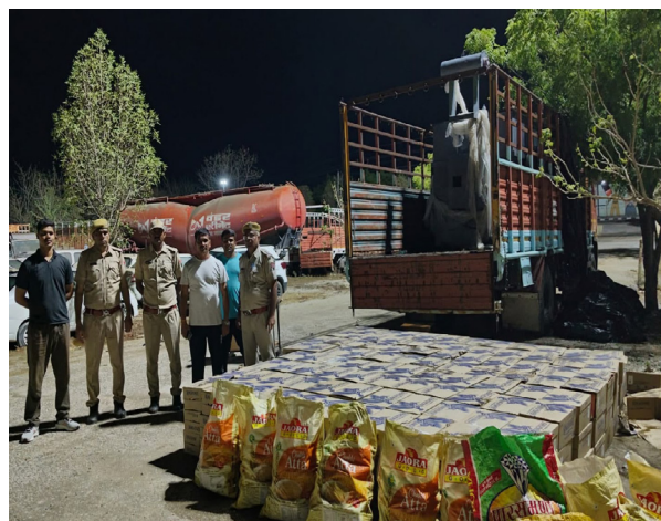
ओर प्रतापगढ़ होते हुए गुजरात ले जाई जा रही है। सूचना पर