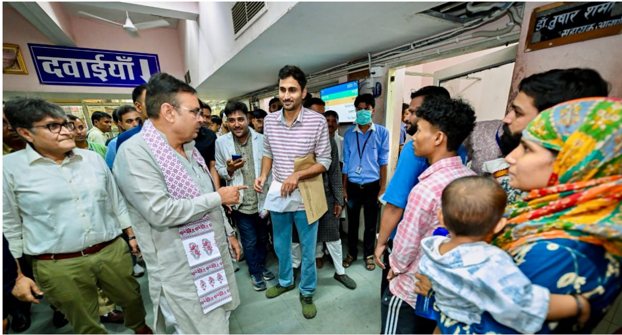
Building, catching officials and staff by surprise as he personally assessed the functioning of OPD services across multiple departments. During the inspection, Sharma reviewed medical

Returning to Jaipur from his Bhilwara visit, the Chief Minister made an unannounced stop at the hospital's Dhanvantari