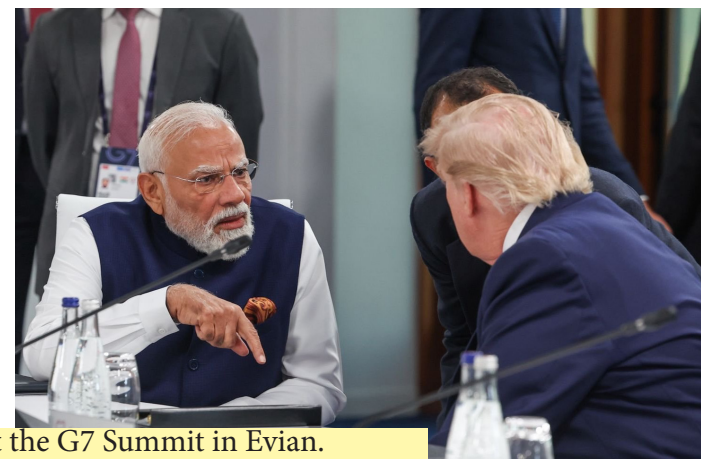
The interactions with world leaders continue at the G7 Summit in Evian.