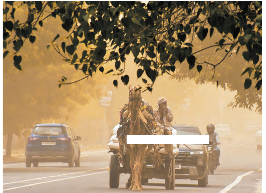
बीकानेर में... धूल भरी आंधी के बीच गुजरती ऊंट गाड़ी का दृश्य थार रेगिस्तान की कठिन परिस्थितियों और पारंपरिक जीवन का एक अद्वितीय मिश्रण है। रेतिले तूफान आते हैं, तो पूरा आसमान धूल के गुबार से भर जाता है।